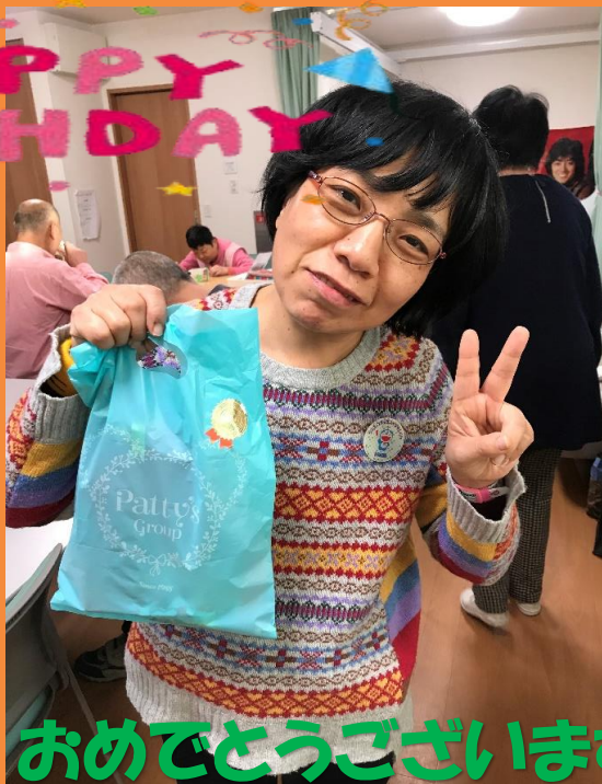
おめでとうございます♪